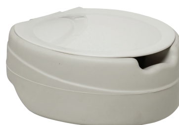
Contact plus ® avec couvercle