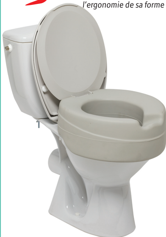
Contact plus ®